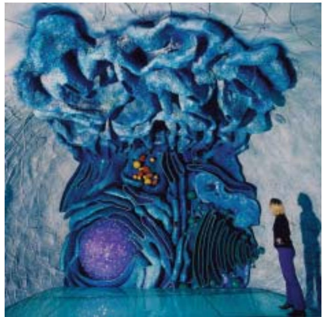
Eine menschliche Zelle im Deutschen Museum in München

„Biosignale sind Botschaften im molekularbiologischen Bereich, die durch spezielle Stoffe, z.B. Hormone, vermittelt werden und dabei Ladungsströmungen (Elektronen, Ionen) in