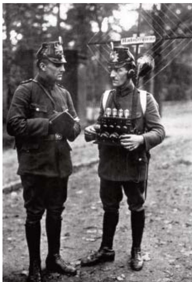
1935: Die Berliner Schutzpolizei experimentiert mit dem mobilen Sprechfunk.

Solange diese Technologie angewandt wird, müssen Schutzwerte gefordert werden, die am Stand der medizinischen Erkenntnis orientiert sind. Varga schlägt einen Weg vor.