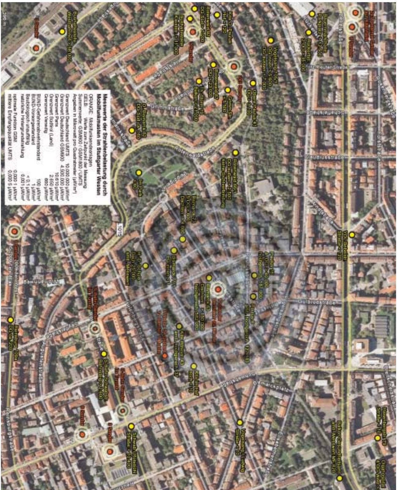
Strahlenbelastung in einer Stadt: Diese Strahlenkarte in Stuttgart-West wurde im Februar 2009 von der Bürgerinitiative Mobilfunk Stuttgart-West veröffentlicht. Die Messungen führten Fachleute durch. Sie zeigt, dass die Strahlenbelastung in einer Großstadt v.a. in den oberen Stockwerken der Häuser zwischen 1000 – und 150.000 µW/m² (0,6 – 7,5 V/m) beträgt, hochgerechnet auf Maximalauslastung der Basisstationen ergab sich sogar ein Wert von 580.000 µW/m² (14,8 V/m). (Gelb: Strahlenbelastung in µW/m². Rot: Standpunkt Mobilfunkmast)